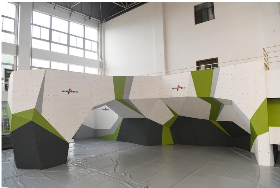
图 5 新落成的抱石墙（尚未定线）