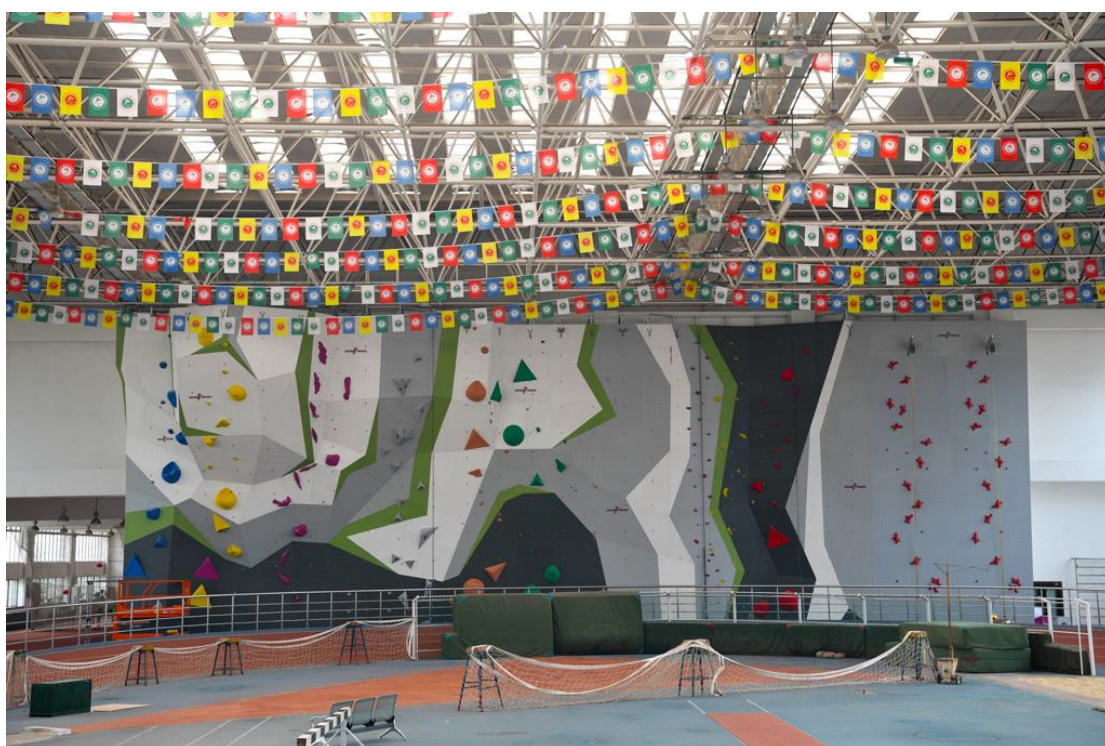
图 4 新落成的难度墙与速度墙