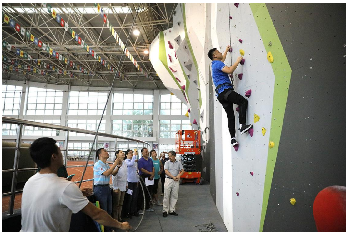
图2 专家组实地考察并体验